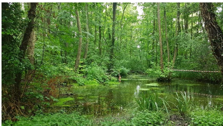
Réouverture d'une mare forestière.

En 2020, dans le cadre du programme Trame verte et bleue, la commune a réalisé des travaux de réouverture d'une mare forestière de 150 m 2 sur sol limoneux-argileux. Cette opération a été encadrée par la LPO et a bénéficié de financements publics à hauteur de 80%.