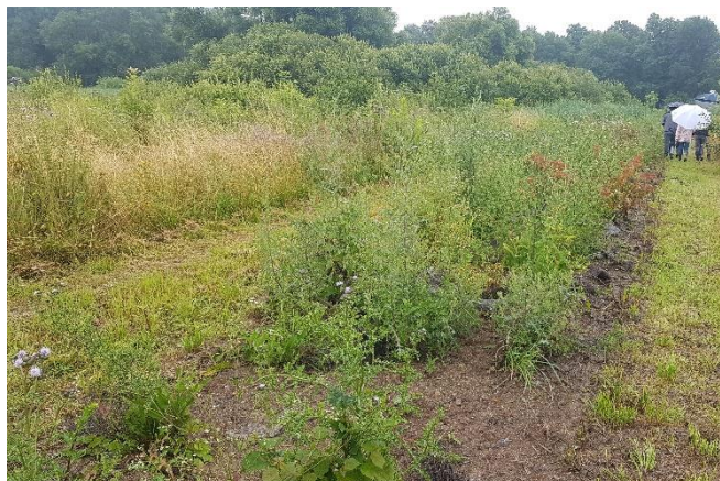
Plantation de haie