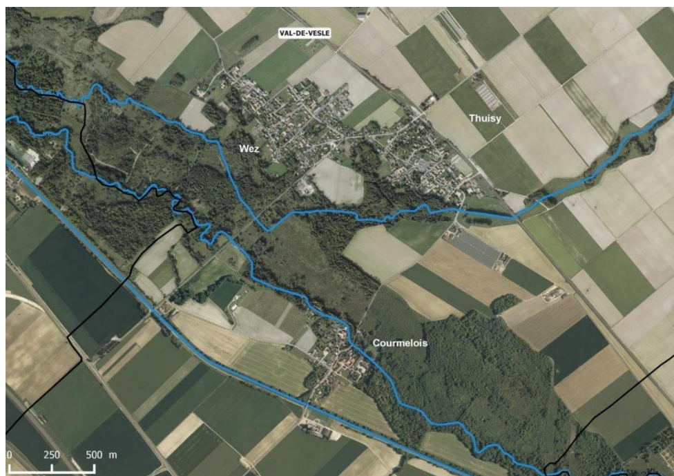
Vue aérienne du territoire de Val-de-Vesle, un village bâti de part et d'autre d'une zone Natura 2000 et traversé par 2 rivières

La Commune de Val-de-Vesle est située dans le département de la Marne, en région Grand-Est. Elle se situe en Champagne crayeuse à cheval sur la vallée de la Vesle, à une quinzaine de kilomètres au sud-est de Reims. Val-de-Vesle est née en 1965 de la fusion de 3 communes (Wez, Thuisy et Courmelois), aujourd'hui appelés "quartiers". Depuis 2017, elle compte parmi les 144 communes de la Communauté Urbaine du Grand Reims (CUGRe). D'une superficie de 3 745 ha, la commune est traversée par le site Natura 2000 que l'on appelle "Marais de Courmelois", sous convention de gestion depuis 2011 par le Conservatoire des espaces naturels de Champagne-Ardenne (CENCA). Située dans une vallée alluviale, Val-de-Vesle constitue une enclave au sein d'un territoire agricole caractérisé par un paysage d'openfield ; le centre du village est traversé par la Vesle et son affluent la Prône mais aussi par le Canal de l'Aisne à la Marne.