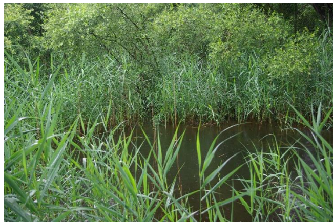
Marais de Courmelois, site Natura 2000, Val-de-Vesle