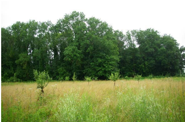
Verger municipal planté d'une centaine d'arbres

Pour sensibiliser les habitants à ce type de plantation, une journée « nature » a été organisée le 31 octobre 2020, proposant la distribution d'arbres fruitiers, de nichoirs et de passages à hérissons pour clôtures.