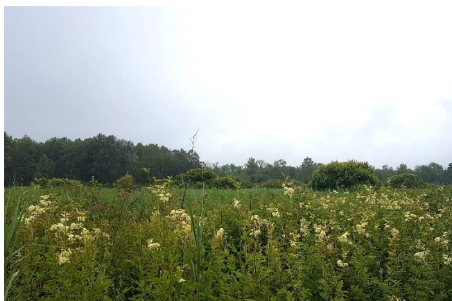
Marais de Courmelois, site Natura 2000, Val-de-Vesle

Lien vers la fiche-action présentée par la commune : http://www.capitale-biodiversite.fr/experiences/restauration-entretien-et-valorisation-des-zones-humides