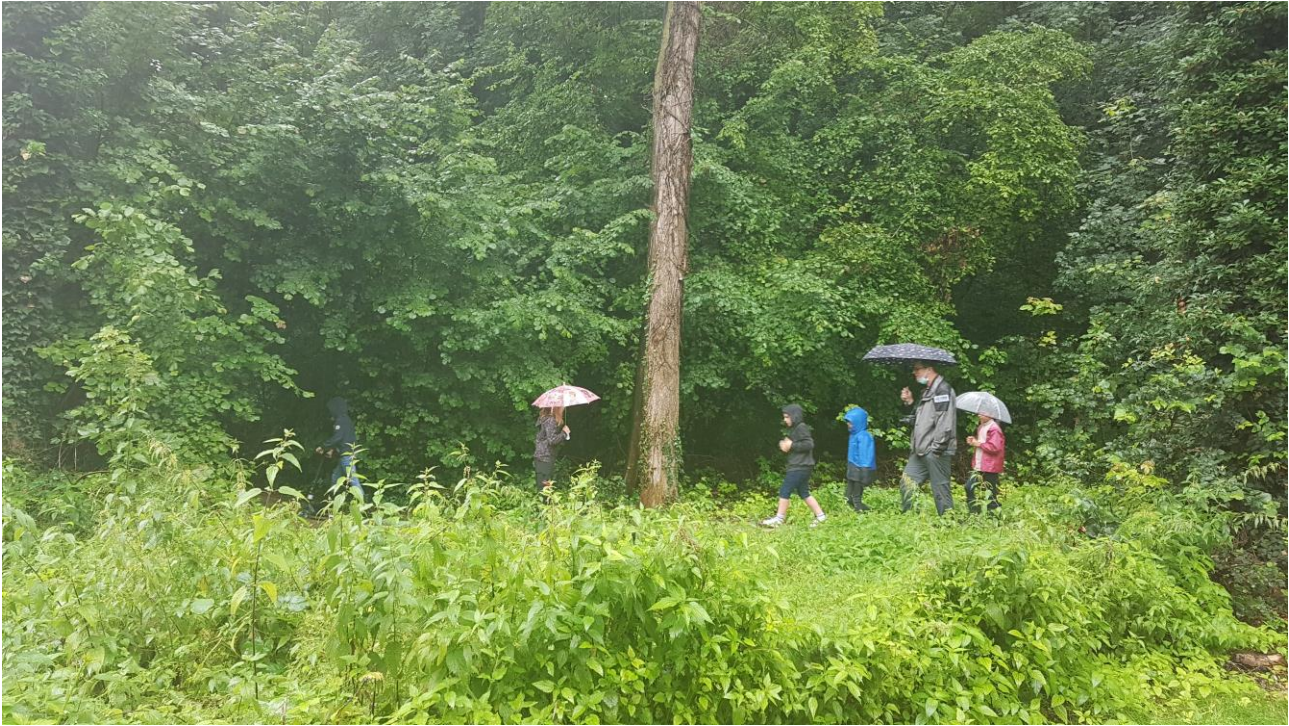
Les élèves de la classe de CM1 de l'école élémentaire de Val-de-Vesle sur leur ATE