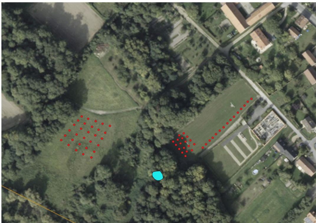
Photo aérienne des Fontainiers (près du cimetière de Wez) avec l'implantation future des arbres fruitiers (points rouge) et rénovation de la mare (en bleu ciel)