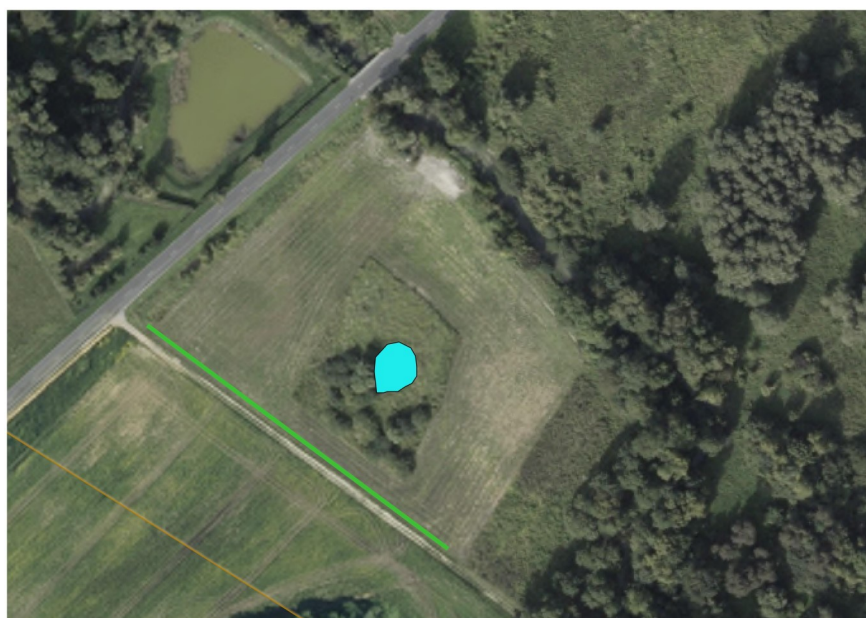
Quartier de Courmelois Chemin de la Merdeuse menant au terrain de camping