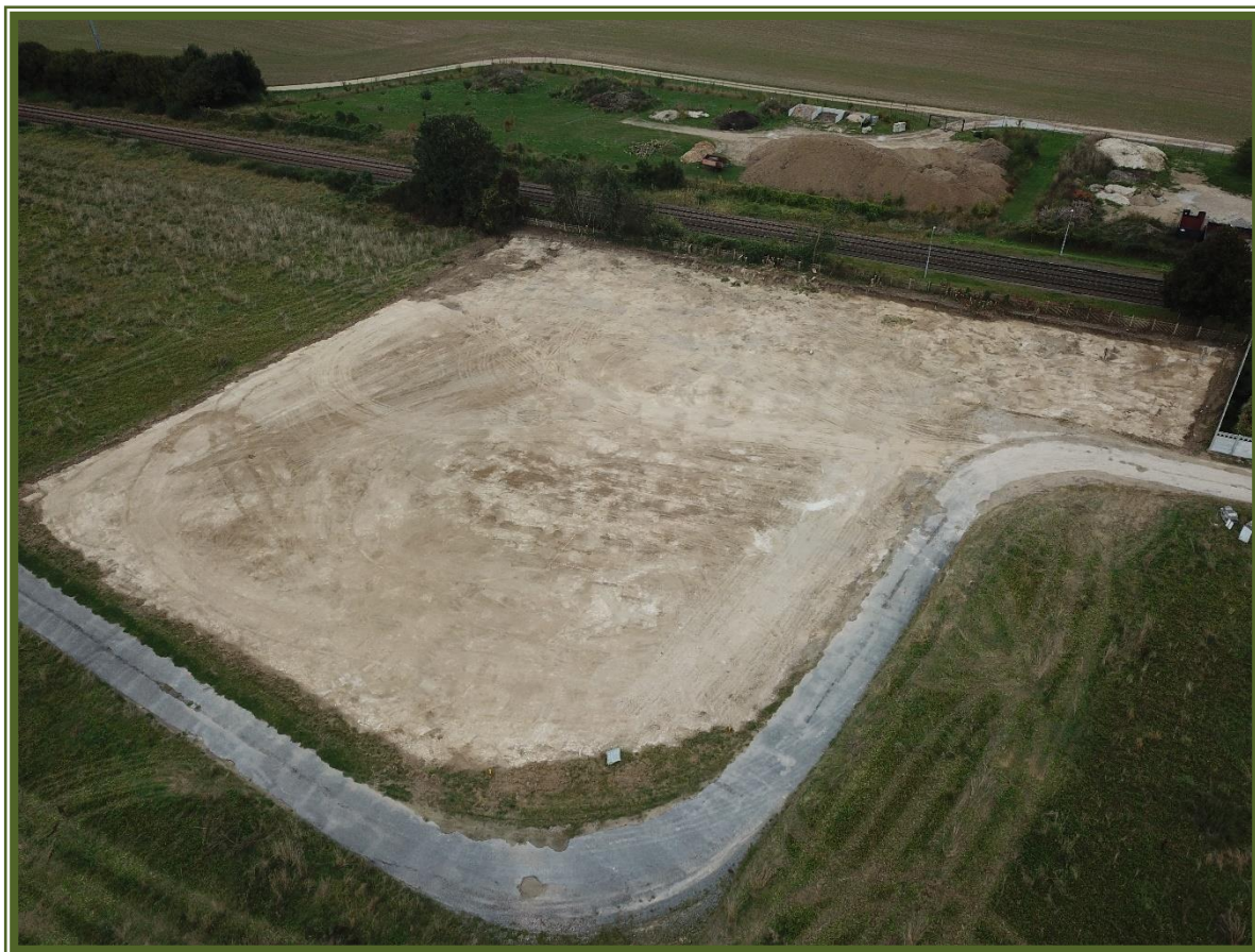
Décapage du terrain pour le futur gymnase

Des réunions de chantier sur place auront lieu tous les mercredis à 9h.